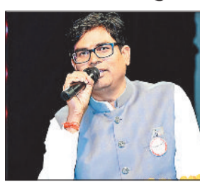
स्वास्थ्य सुविधाओं के लिए यह पहल जिले वासियों के लिए मिल का पथर साबित होगी

रायगढ़। जर्जर हो चुके 100 बिस्तर वाले सेंट किरोड़ीमल शासकीय चिकित्सालय के 300 बिस्तर में तब्दील वित्त मंत्री ओपी चौधरी की पहल पर 40 करोड़ स्वीकृत किया गया है। बढ़ते औद्योगिकरण के दबाव के मद्देनजर जिला चिकित्सालय के उन्नयन की आवश्यकता लंबे समय से महसूस की जा रही थी। वर्षों पुरानी यह 100 बिस्तर चिकित्सालय जर्जर अवस्था में पहुंच चुका था। बिस्तर की संख्या बढ़ाते हुए इसके उन्नयन का निर्णय लिया गया।