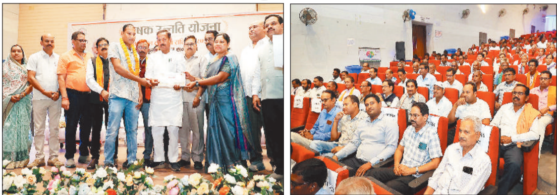
किसान को प्रमाण पत्र सौंपते राज्यसभा सांसद और कार्यक्रम में उपस्थित किसान।

इस दौरान जिले के किसानों को पुष्पहार से स्वागत किया गया और उन्हें प्रमाण पत्र दिया गया। इस साल जिले में 72 हजार 693 किसानों ने समर्थन मूल्य पर धान बिक्री किया है। इन किसानों ने 4 लाख 78 हजार 240.60 एमटी धान बिक्री किया है। इसकी राशि तो पहले ही मिल गई थी, लेकिन बोनस की राशि बाकी थी। शनिवार को इस राशि को किसानों के खाते में जमा करने बिलासपुर में एक कार्यक्रम का आयोजन किया गया था। यहां सीएम श्री साय ने एक क्लॉक कर किसानों के खाते में राशि अंतरण किया। इस अवसर पर वृत्तुअल माध्यम से किसानों को संबोधित करते हुए मुख्यमंत्री विष्णुदेव साय ने कहा कि आज का दिन किसानों के सम्मान और स्वाभिमान का दिन है। उन्होंने कहा कि